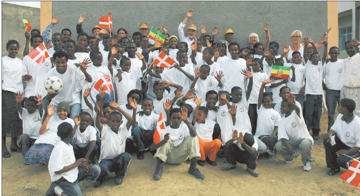
Pengene til børnehjemmet i byen Mekele kommer fra den lille forening Ethiopiens Børn. Foreningen har til formål at støtte konkrete projekter til fordel for levevilkår og uddannelse for børn i Etiopien.

FN anslår at omkring 50% af landets befolkning lever på eller under fattigdomsgrænsen. På The Human Development Index er Etiopien nummer 169