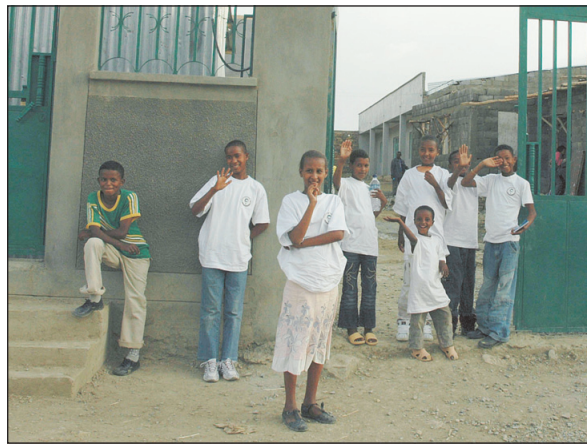
Børnene får hjælp og støtte fra de voksne, der er tilknyttet hjemmet, og mulighed for at få en uddannelse.