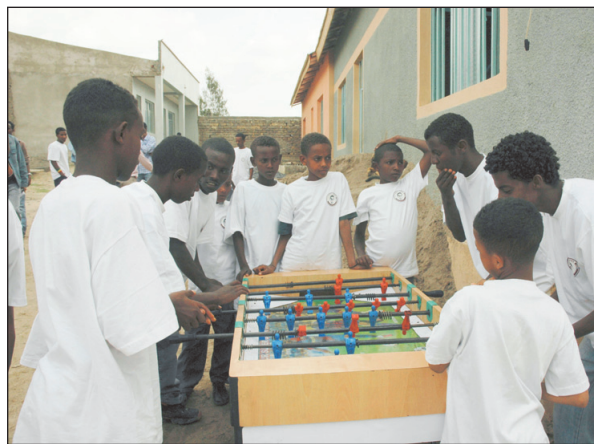
Et brugt bordfodboldspil vækker vild jubel og lynhurtigt er en større gruppe drenge i gang ved bordet.